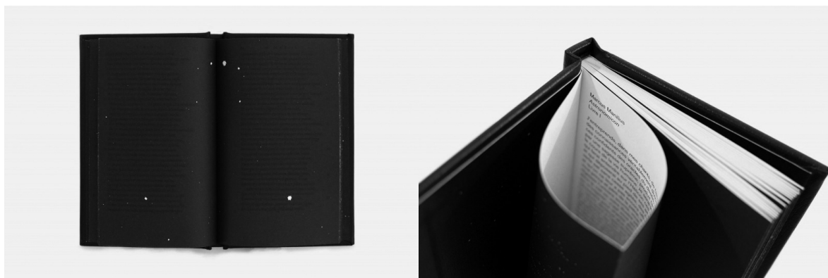
Fanette Mellier, Astronomicon , éditions B42, impression Arts & caractères, 12 x 18 cm, 64 pages, 2013.

plongé dans une « nuit » mystérieuse, pour reprendre les mots de l'artiste 14 . En d'autres termes, le texte est imprimé en noir sur un fond bleu marine, un contenu qui est donc totalement illisible. Pour en comprendre le sens, il faudra déchirer les pages reliées à la japonaise afin d'y lire, au verso, la traduction en français. Le lecteur se retrouve donc tiraillé entre deux envies : découvrir le sens caché du texte en intervenant physiquement sur l'ouvrage, ou bien conserver le livre et le mystère intact.