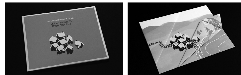
Julie Stephen Cheng, Les aventures d'un village , Éditions Volumiques, 27,8 x 35 cm, 2012.

Le pli, sans rien ajouter, permet pourtant de transformer une surface simple en un volume complexe, et dans Les Aventures d'un village , c'est l'illustration elle-même qui se trouve transformée.